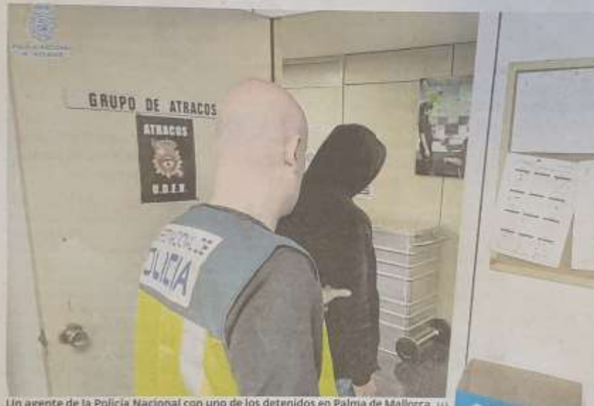
Un agente de la Policía Nacional con uno de los detenidos en Palma de Mallorca. (1)

Seguidamente, comenzó a recibir mensajes amenazantes, a través de una aplicación de mensajería digital, para que pagara varias