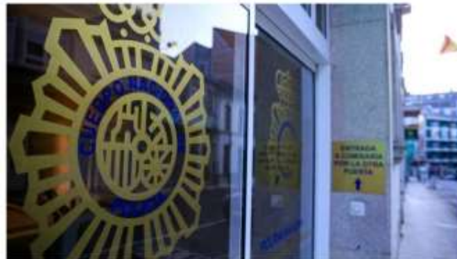
Comisaría de la Policía Nacional en Lugo

El varón ingresó en prisión por un delito de grooming , acoso sexual hacia menores por Internet