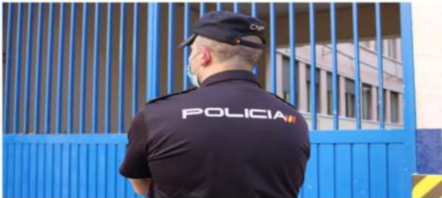
Un agente de la Policía Nacional.